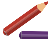
Feutres ou crayons de couleurs